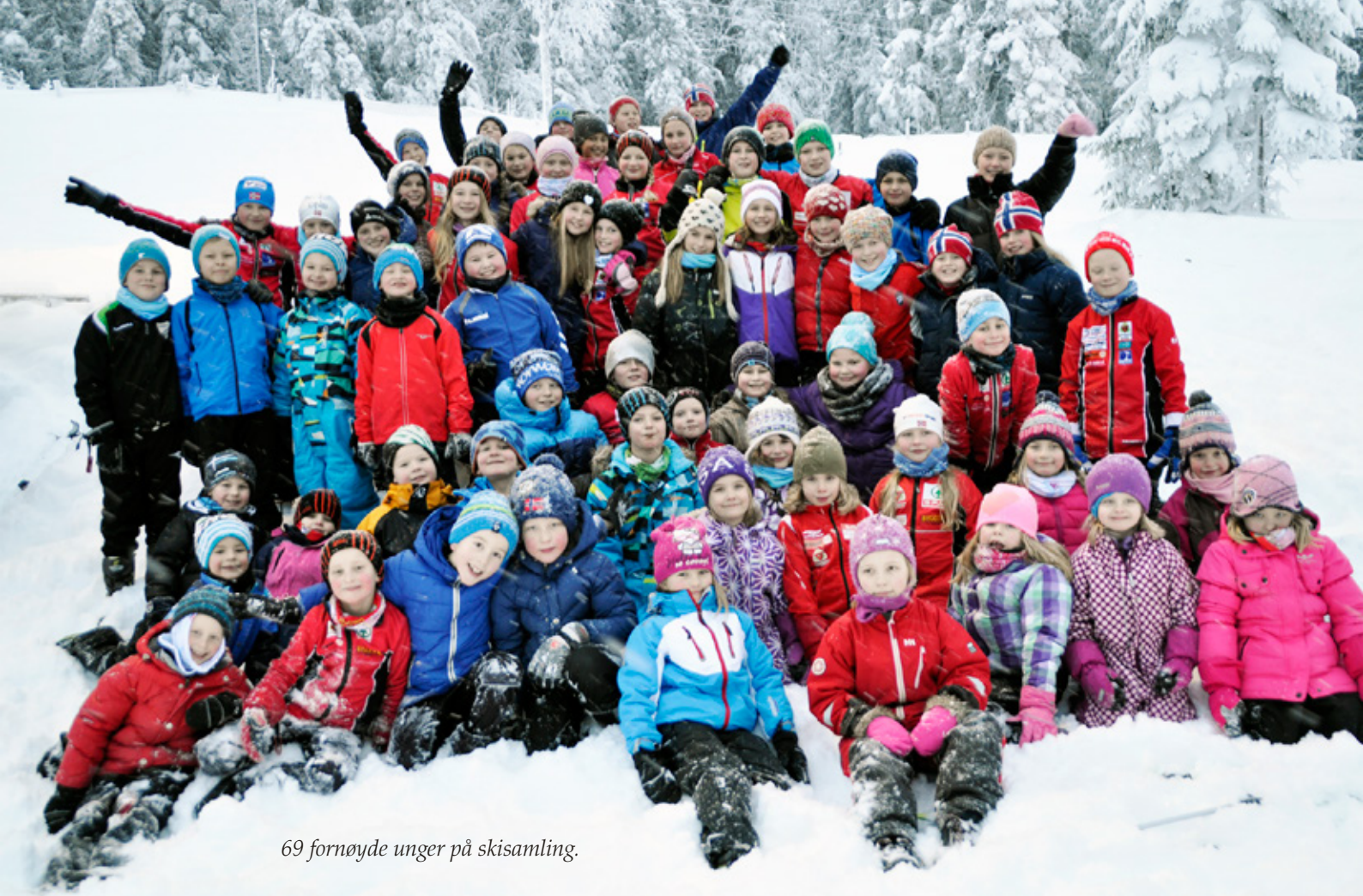
69 fornøyde unger på skisamling.