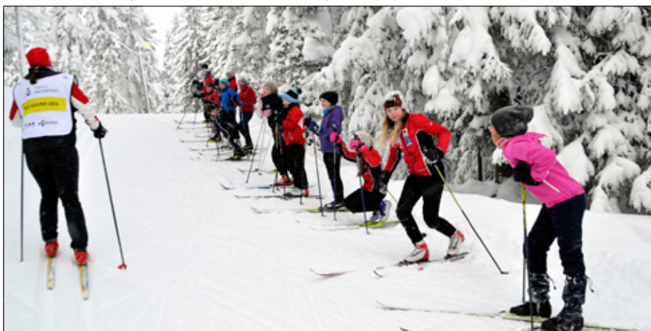
Kort instruksjon før igangsetting.