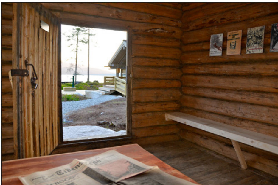
Fønhusrommet i Stabburet ved Fønhuskoia er allerede blitt en stor suksess med rekordstort antall overnattingdøgn.

Det er fått til flere ting som bl.a. Fønhuskoia som allerede er blitt en stor suksess med mange besøkende og antall overnattinger som slår alle rekorder i området. Akkurat nå jobbes det med å etablere flere Fønhusstier i kommunen. Det pågår også leting etter motorsykkelen til Mikkjel Fønhus, og arbeid for å få opp informasjonskilt på E-16 i forhold til Nissebakken/Fønhusstien.