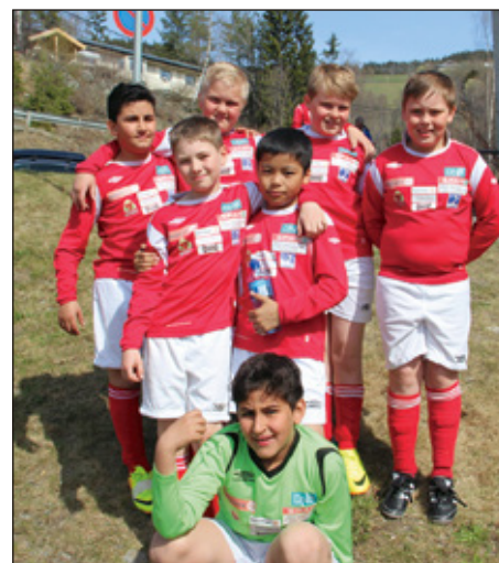
Et annet minigutt-lag fra Bagn