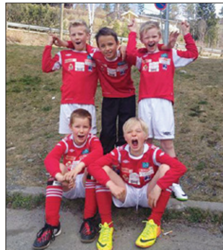
Ett av Bagn ILs miniguttlag.

Vi oppfordrer samtidig flest mulig til å ta turen til Fossvang for å skape stemning på kampene. Følg med på bagn.no for nærmere presentasjon av lagene, terminlister og omtale av spilte kamper.