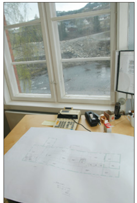
Planene med utsikta

Ta kontakt med eierne, Laila, 950 72 466 eller Oddvar 915 58 888