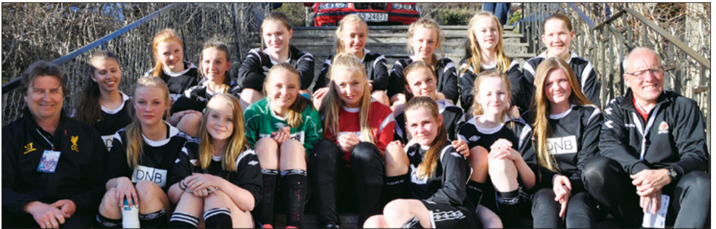
Samarbeidslaget Begnadalen/Bagn/Hedalen J16 gikk helt til topps i DNB-cupen i år.