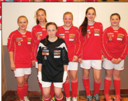
Småjenter er delt i to lag for DNB-cup. Her er det ene,