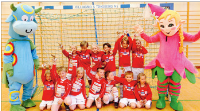
Knøttelagene på DNB cup