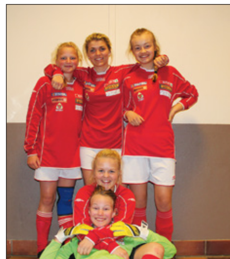
- og her er det andre.