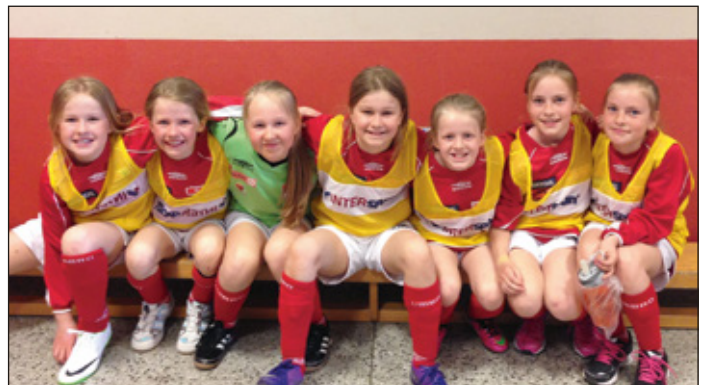
Ett av de to minijentelagene til Bagn IL