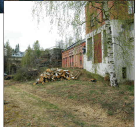
Bygget kjem fram

Bagn eller vurderer å flytte til eller etablere en avdeling eller etablere bedrift her. Det legges opp til at leietagerne selv finner ut av hvilken fellestjenester de vil ha, utover det som blir etablert av infrastruktur.