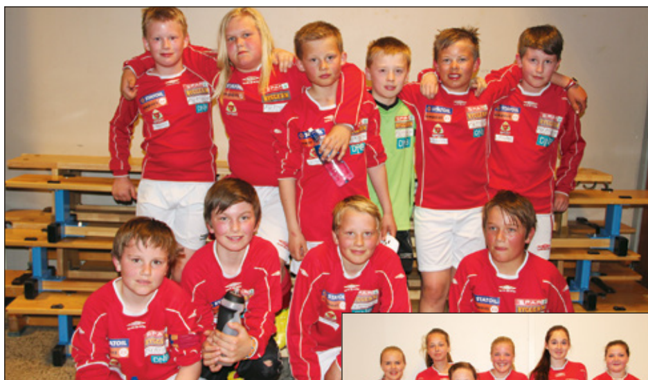
Lillegutt fra Bagn