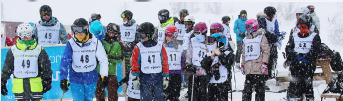
Klare for parallell slalom.