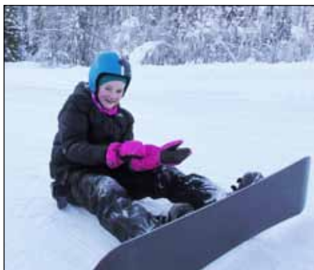
Ida tok utfordringen med snowboard.