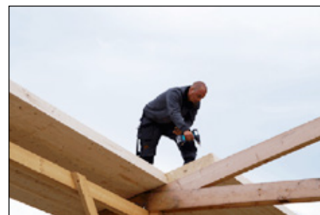
Elementene skrues fast.