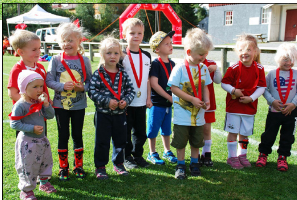
Premieutdeling for de minste utøverne.