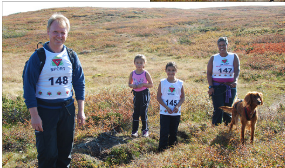
Familien Dølven storkoser seg på fjelltur.