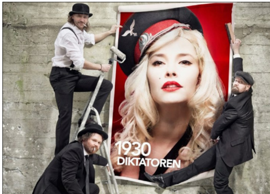
1930 - Diktatoren. Frekt, fornøylig og fullstendig fascistisk!

Statsteatret ønsker velkommen til forestilling i deres prosjekt av produksjoner dedikert rettskrivingen av Norgeshistorien. Forestillingen går 15. oktober på norde lokalet i Hedalen.