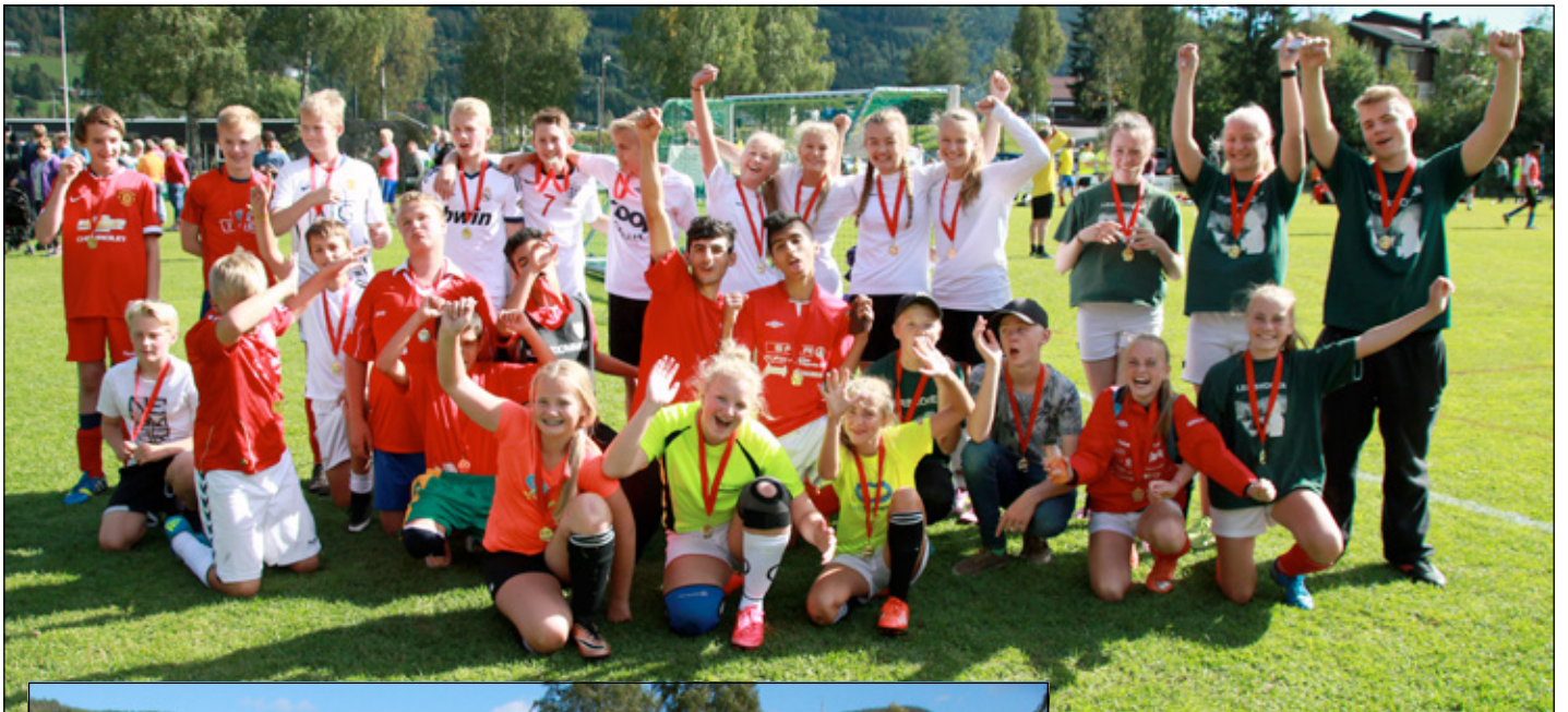
De tre beste lagene i klassen 12 til 16 år, Østre Bagn, Reinli og Leirskogen.