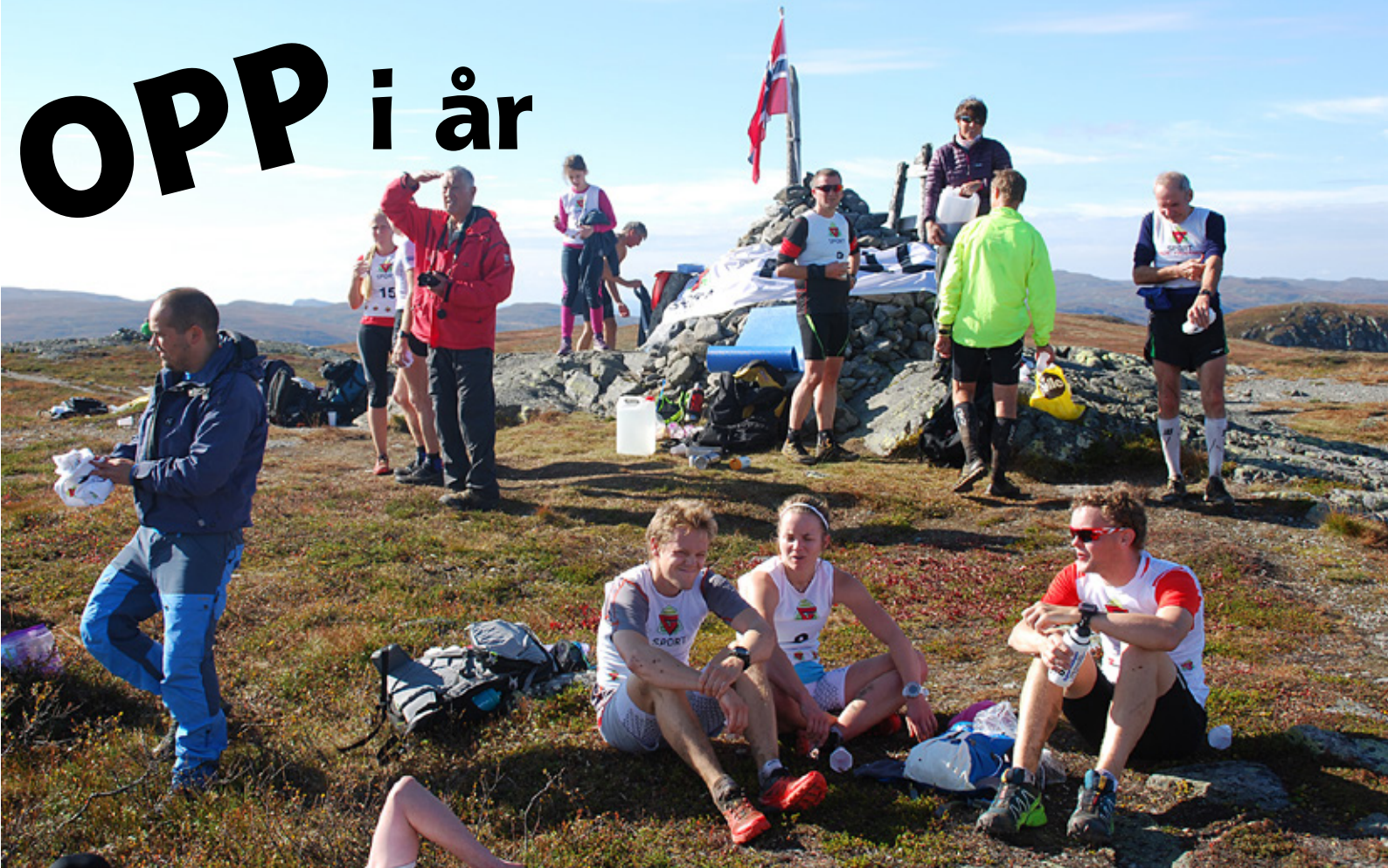
Strålende forhold på toppen.