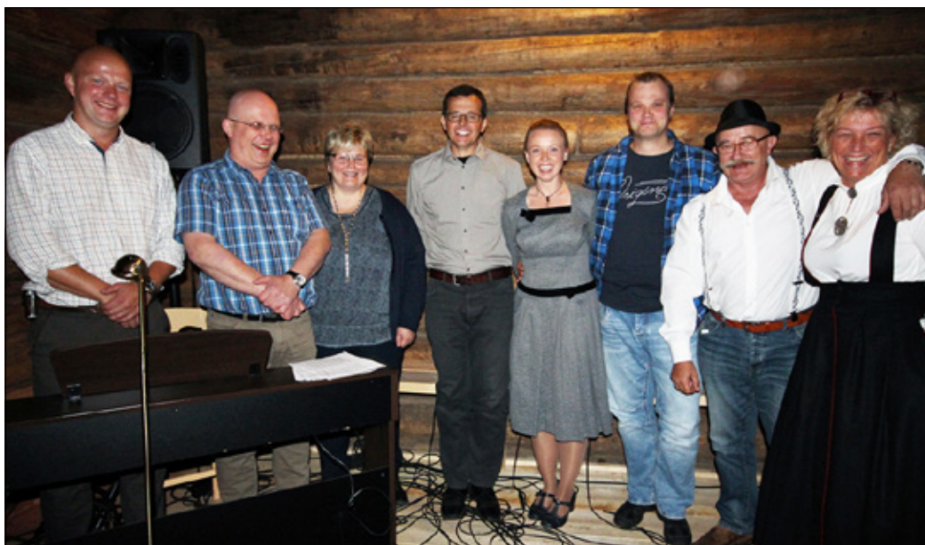
Tolket Alf Prøysen.