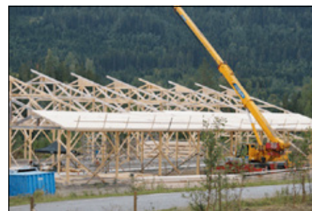
Takelementene heises på plass av en stor kran.