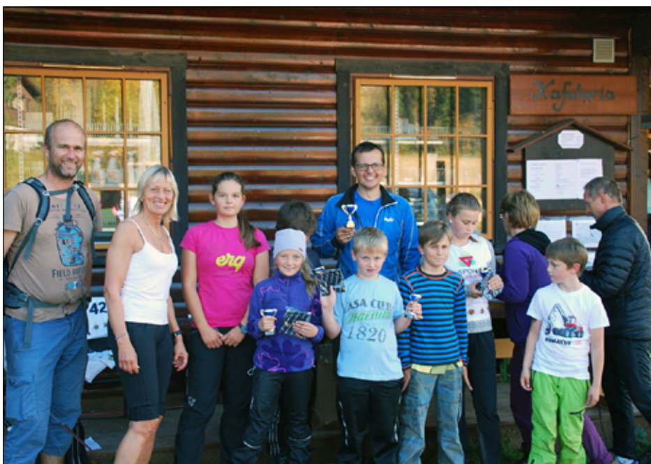
Utenom konkurranseklasse var det 10 trimmere som fullførte Kongsvegtrippelen.

Det er riktig hyggelig å stifte bekjentskap med hytteeiere i området, men arrangørene fra Bagn IL og Begna IL skulle gjerne sett flere lokale deltakere til arrangementet. Fjellet har kapasitet