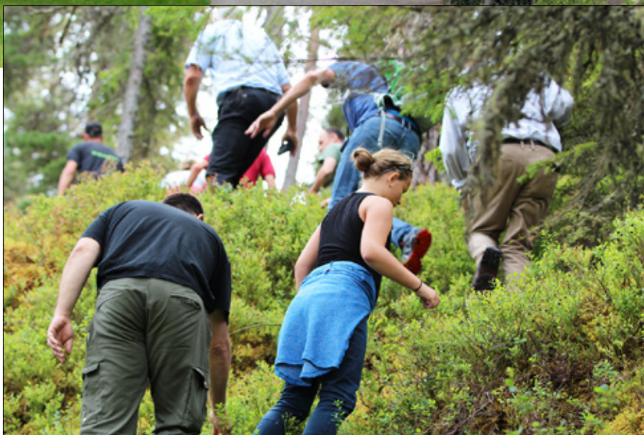
Øverste bildet: Tunet på Bagn Bygdesamling sett ovenfra. Bratt terreng opp til stillingen hvor norske soldater stanset de tyske i april-dagene 1940.

Museet er en populær møteplass og utgangspunkt for turer. I hovedhuset er det en samling av våpen, uniformer og annet utstyr fra krigsårene 1940 – 1945. Noen hundre høydemeter ovenfor museet finner du en krigshistorisk stilling hvor norske soldater stoppet tyskerne i april 1940, og en bergsprekk hvor de berget livet. Omvisning kan du